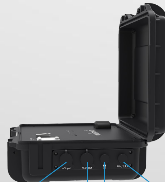
AC輸入 AC輸出 遙控器 潛航器接口 & 充電口